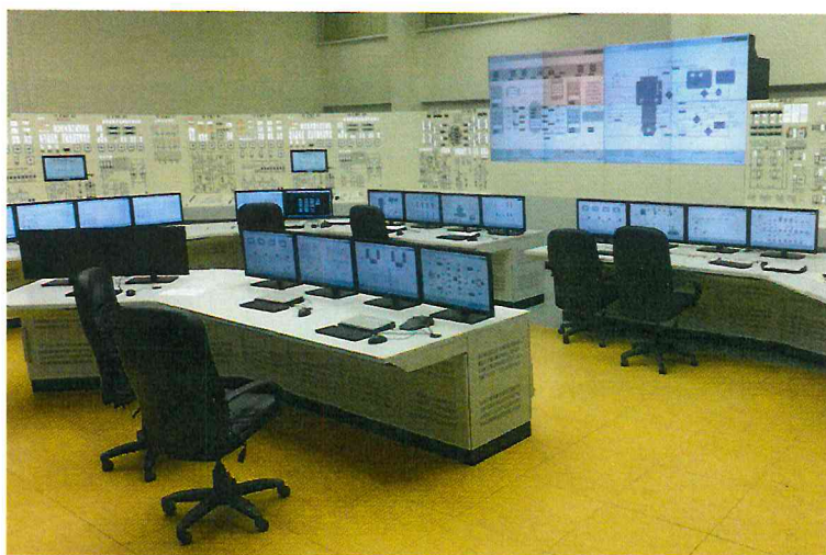
Рисунок 1 Общий вид комплекса программно-технического «ВА2020»